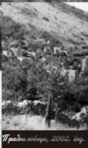
Предилловци, 2002. год.