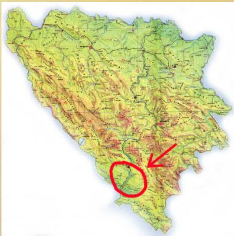
Карта БиХ. У црвеном кругу је простор којим се бави ова књига.

Како је та опасност претила и овом тексту, који се бави страдањем српског народа у делу јужне Херцеговине у размаку од пола столећа, 1941. и 1992. године, аутор је настојао да своје писање о конкретним дешавањима темељи искључиво на чињеницама, које могу да се провере из више независних извора. Све остало, укључујући и то коме те чињенице не одговарају, тиче се сложенијег питања истине о злочинима у националним и верским ратним сукобима у вишенационалним и вишеконфесионалним зајдницама.